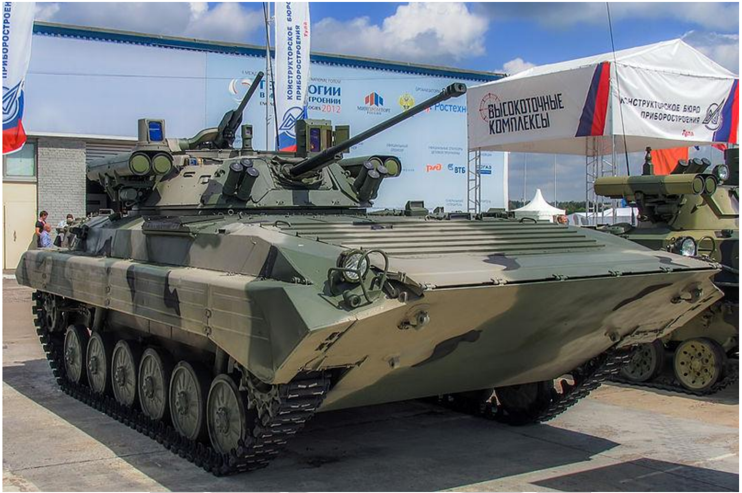
БМП 2 М