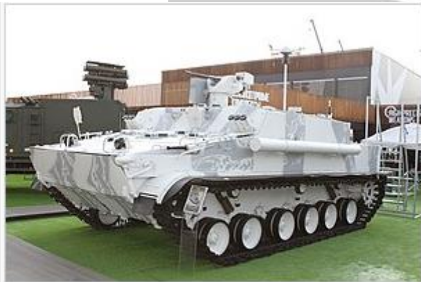
Бронетранспортёр БТ-3Ф на МВТФ «Армия-2021».