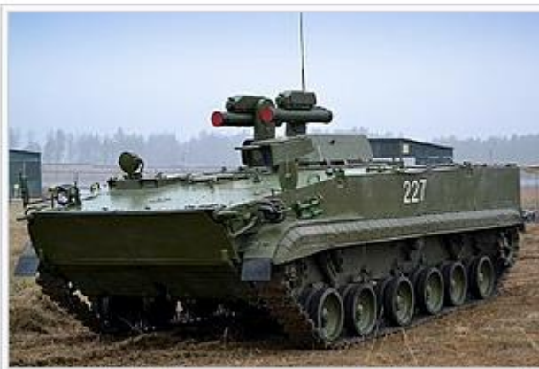
Корнет-Т в 1000-м учебном центре боевого