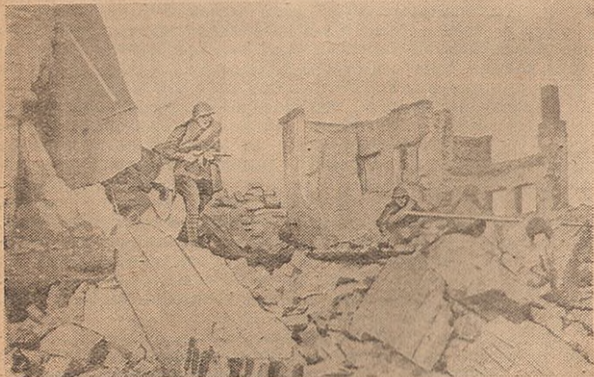
В Сталинграде. Войска Н-ской части в наступлении.

Решительность, инициатива, быстрота действий и храбрость всегда приводят к победе.